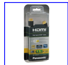
Câble HDMI 1.5m